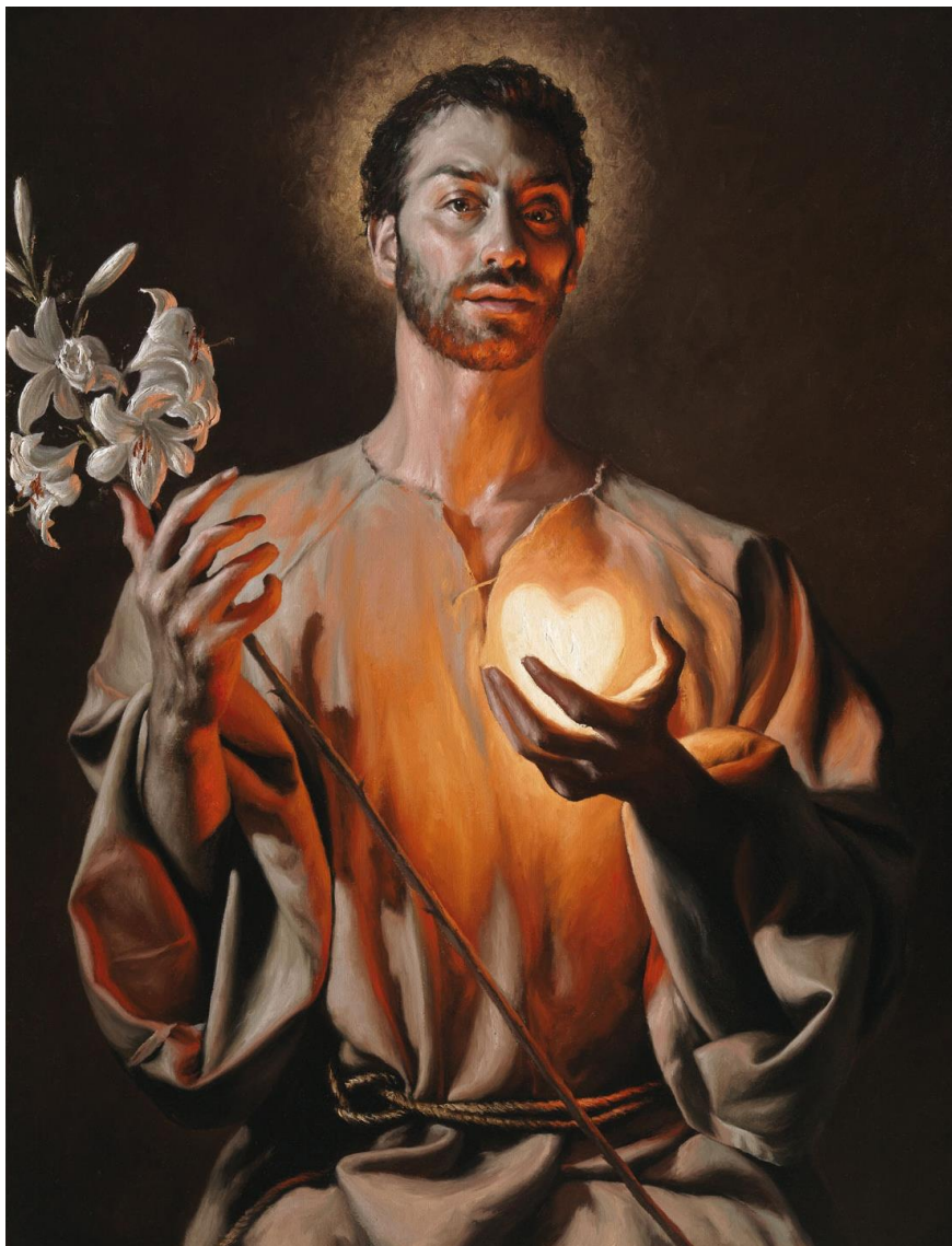
GIOVANNI GASPARRO, IL CUORE CASTISSIMO DI S. GIUSEPPE